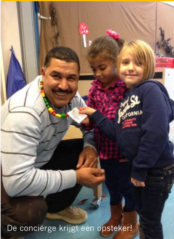
De conciërge krijgt een opsteker!