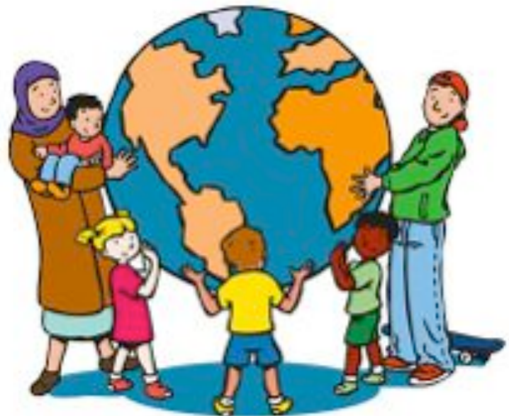
De Vreedzame Wijk