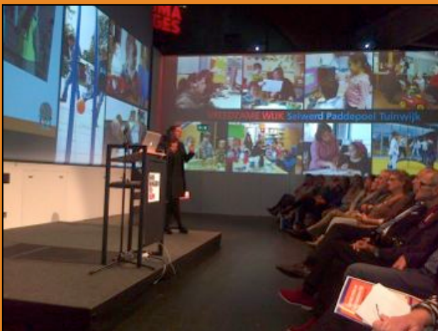
Op 14 oktober jl. vond de startbijeenkomst plaats van De Vreedzame Wijk in Groningen. In vier wijken werken scholen, ouders, wijkinstellingen en andere opvoeders sinds kort ook samen aan De Vreedzame Wijk.

In Vreedzame Wijk 2.0 ligt de focus op ouders en bewoners. Een parallelprogramma voor ouders van Vreedzame Scholen wordt i.s.m. ouders ontwikkeld en de eerste groepen Vader- en Moedermediatoren worden getraind.